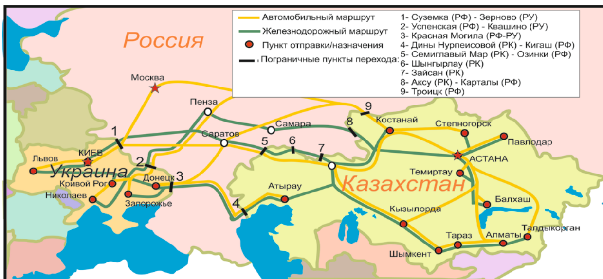
Рисунок 3. Маршруты доставки казахстанских грузов в Украину

Ниже в таблице 5 представлены примерные расчеты оптимальных маршрутов доставки казахстанских товаров из Казахстана в Украину. Оптимальные варианты доставки выделены цветом.