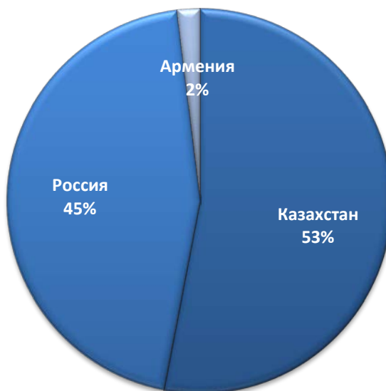
Рисунок 4. Доля основных поставщиков на рынок Узбекистана в 2013 году, %