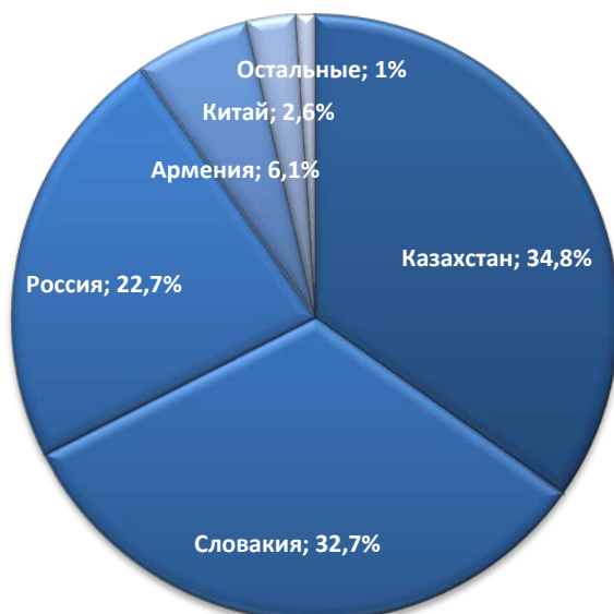
Рисунок 2. Доля основных поставщиков карбида кальция на рынок Украины в 2013 году, %