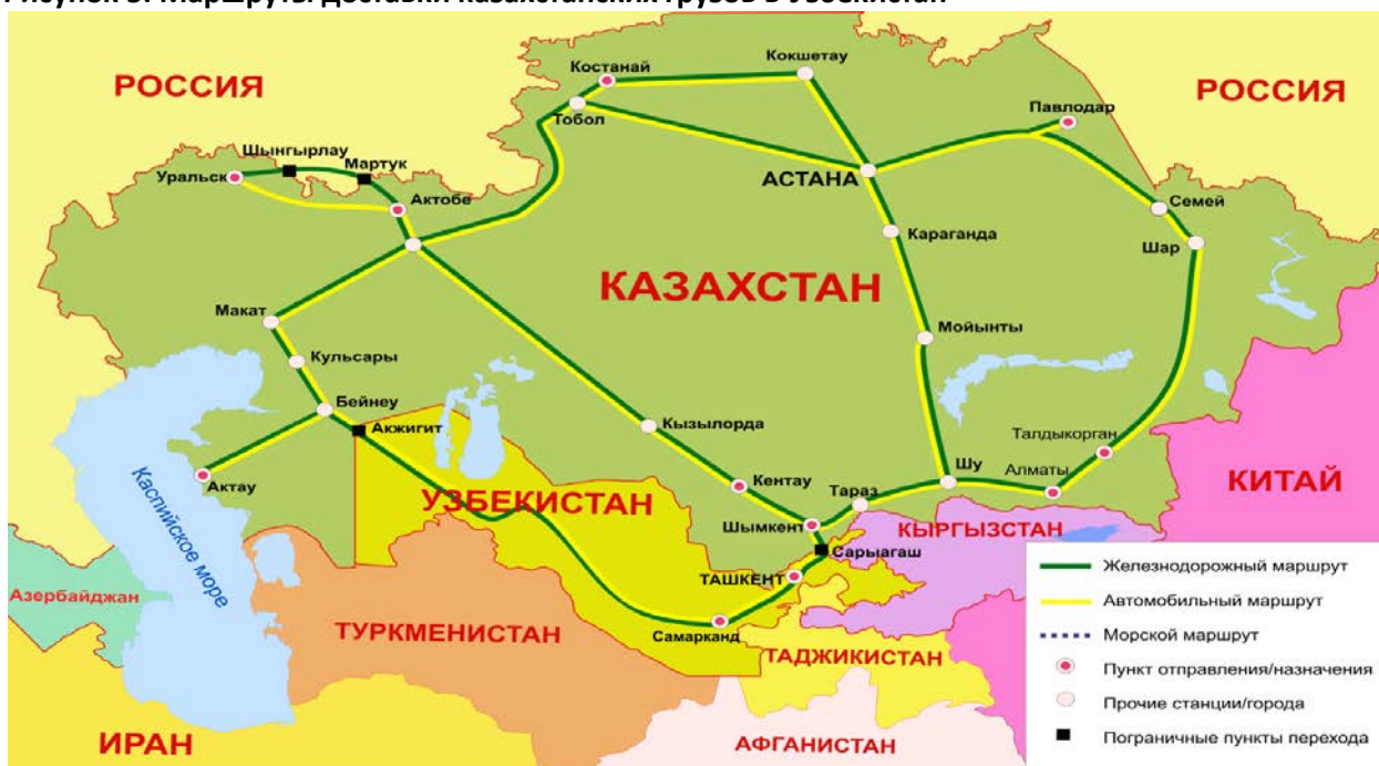
Рисунок 5. Маршруты доставки казахстанских грузов в Узбекистан

Казахстанские грузы доставляются в Узбекистан по железной дороге или автомобильным транспортом (рис. 6).