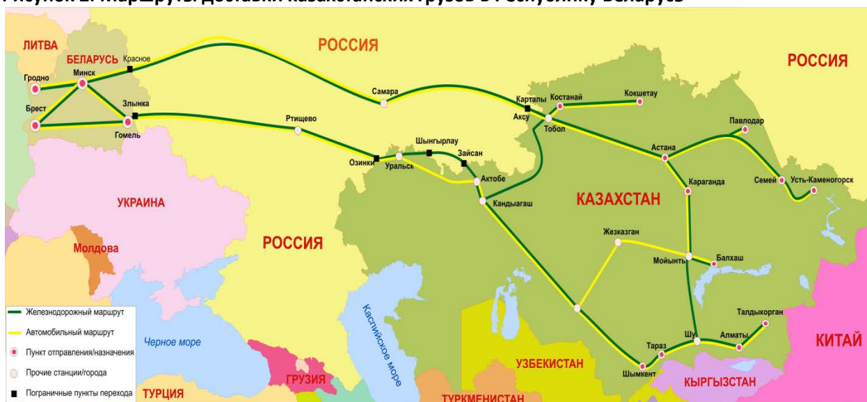
Рисунок 2. Маршруты доставки казахстанских грузов в Республику Беларусь

В таблице ниже приводится примерный расчет стоимости доставки казахстанских товаров из Казахстана в Беларусь. Цветом выделен наиболее оптимальный вариант доставки.