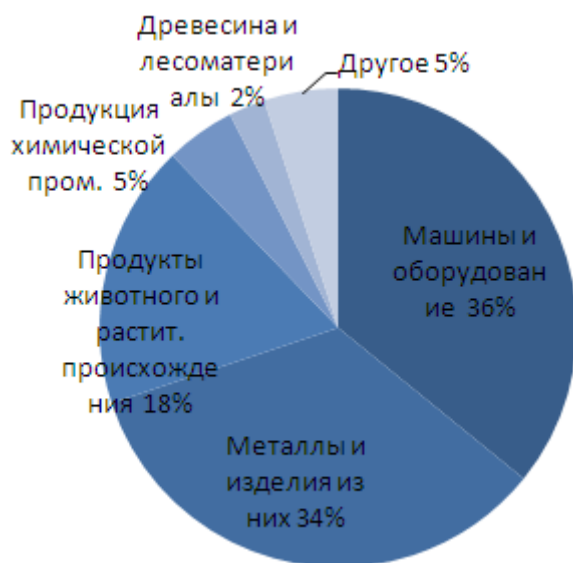
Рисунок 4. Структура импорта в РК из Украины за 2009 году

В структуре импорта основную долю занимают машины и оборудование (36%), металлы и изделия из них (34%), далее следуют продукты животного и растительного происхождения (18%), продукция химической и связанных с ней отраслей промышленности (5%). Доля четырех указанных видов продукции занимает 92% (рис.4).