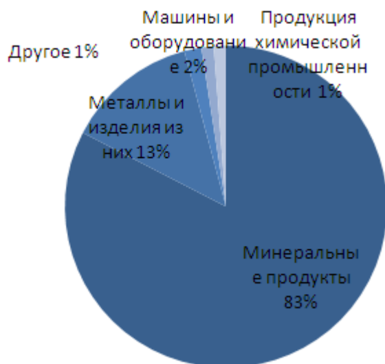
Рисунок 3. Структура экспорта РК в Украину за 2009 году

Основной статьей экспорта являлись минеральные продукты (83%), далее следуют металлы и изделия из них (13%), машины и оборудование (2%), продукция химической и связанных с ней отраслей промышленности (1%). Доля четырех указанных видов продукции занимает 99% от общего экспорта (рис.3). Практически по всем позициям наблюдалось значительное снижение объемов экспорта.