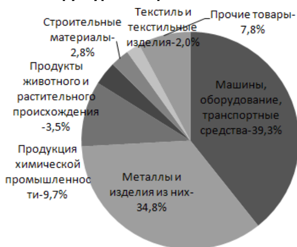
Рисунок 4. Структура импорта в РК из Китая за 2009г.

В структуре импорта основную долю занимают машины, оборудование, транспортные средства, приборы и аппараты (39,3%), далее следуют металлы и изделия из них (34,8) продукция химической и связанных с ней отраслей промышленности (9,7%). Доля указанных видов продукции занимает 83,9% (рис.4).