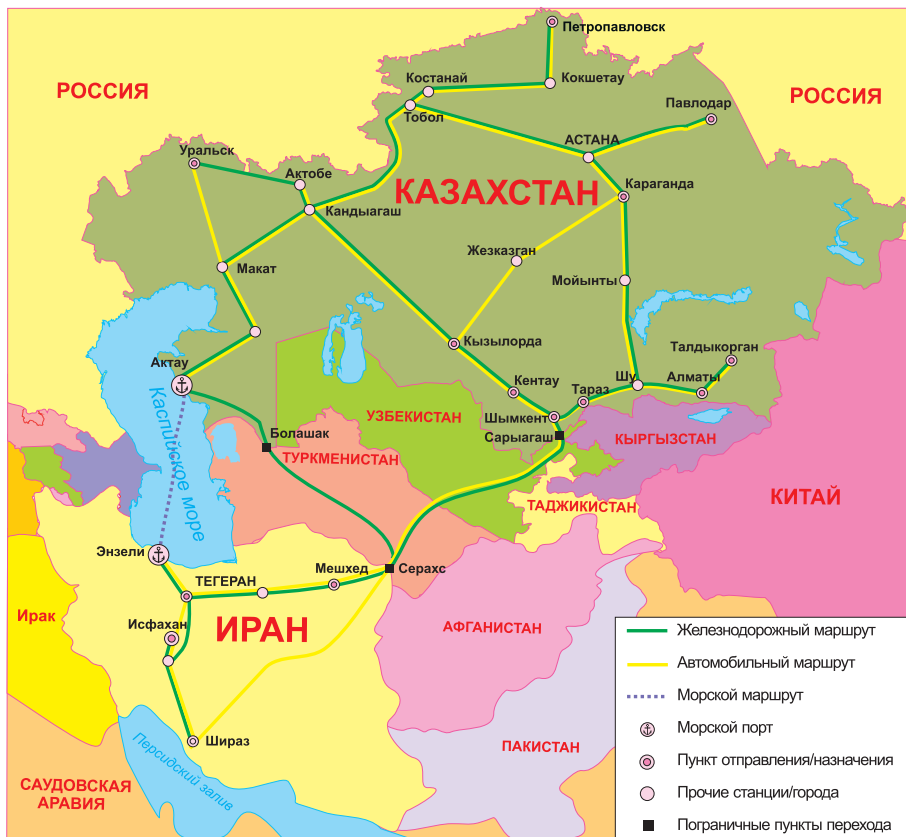
Маршруты доставки казахстанских грузов в Иран