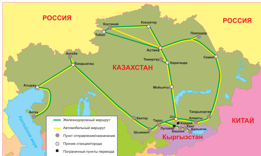
Маршруты доставки казахстанских грузов в Кыргызстан