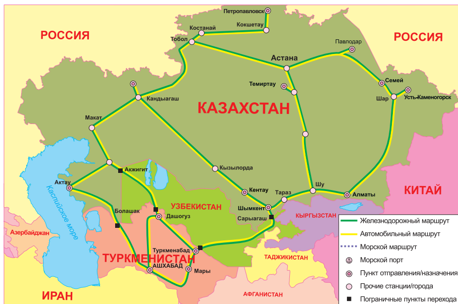
Маршруты доставки казахстанских грузов в Туркменистан