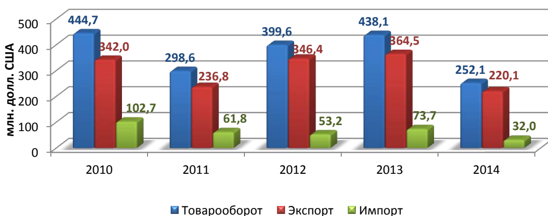
Рисунок 1. Динамика внешней торговли Казахстана с Азербайджаном, млн. долл. США