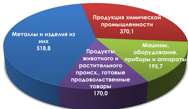
Рисунок 1. Структура перспективной экспортной продукции Казахстана в Азербайджан в разрезе товарных групп, млн. долл. США