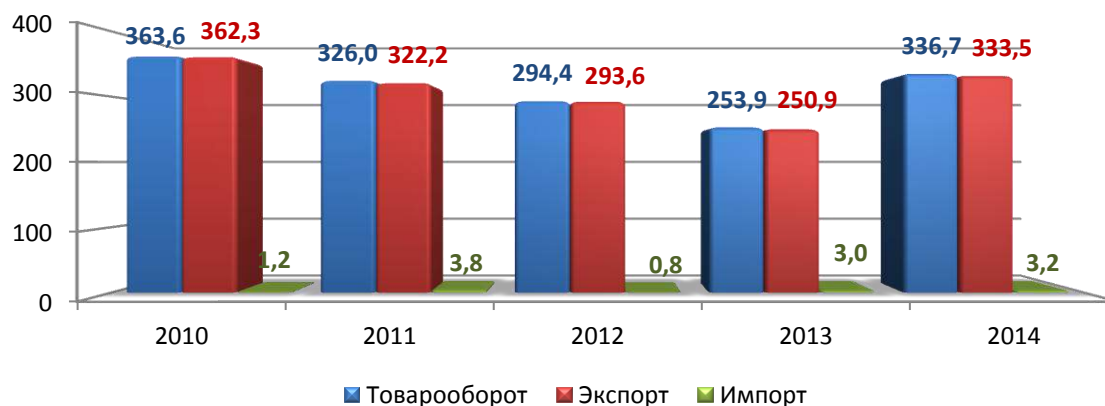
Рисунок 1. Динамика внешней торговли Казахстана с Афганистаном, млн. долл. США