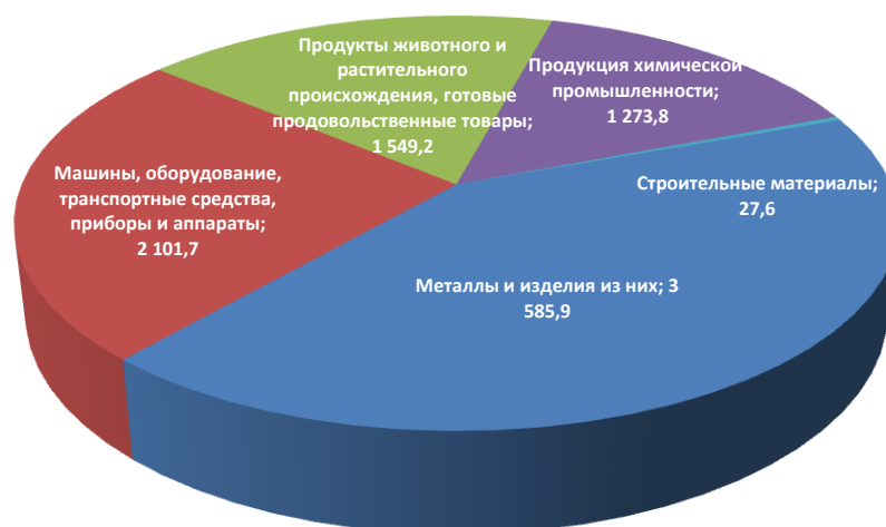
Рисунок 2. Структура перспективной экспортной продукции Казахстана во Вьетнам в разрезе товарных групп, млн. долл. США