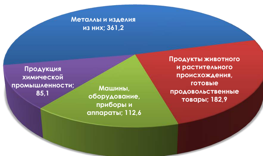
Рисунок 2. Структура перспективной экспортной продукции Казахстана в Латвию в разрезе товарных групп, млн. долл. США