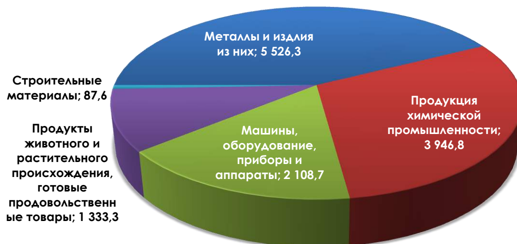
Рисунок 2. Структура перспективной экспортной продукции Казахстана в Турцию в разрезе товарных групп, млн. долл. США