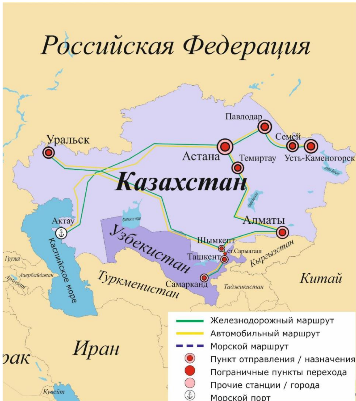
Рисунок 3. Маршруты доставки товаров из Казахстана в Узбекистан

Схематическое изображение маршрутов доставки представлено на рисунке 3.