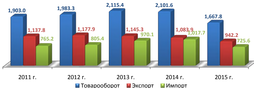
Рисунок 1. Динамика внешней торговли Казахстана с Узбекистаном, млн. долл. США